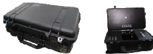
ภาพแสดงระบบ T-Box 3.0 Jammer