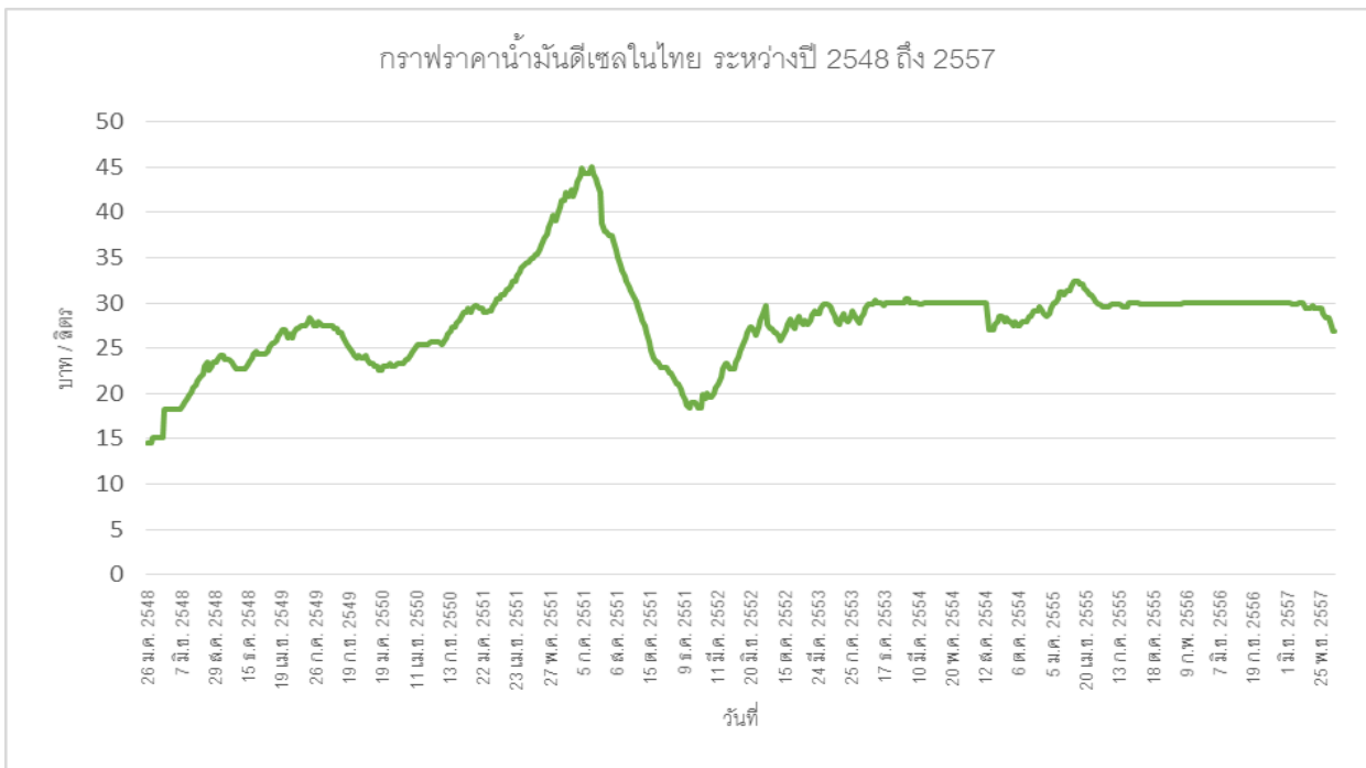
ที่มา : ราคาน้ำมันย้อนหลัง บริษัท บางจากปิโตรเลียม จำกัด (มหาชน), 2558

ความเสี่ยงที่อาจเกิดขึ้นจากความผันผวนของราคาน้ำมันดีเซลได้ระดับหนึ่ง กอปรกับสัญญาของลูกค้าที่กำหนดอัตราค่าบริการแบบคงที่ ระบุเงื่อนไขให้บริษัทสามารถเจรจากับลูกค้าได้หากราคาน้ำมันมีการเปลี่ยนแปลง รวมถึงการกำหนดค่าบริการเฉพาะค่ารถและค่านักขับแบบคงที่ต่อเนื่อง ซึ่งถือเป็นการสร้างรายรับที่แน่นอน และยังเป็นการช่วยให้บริษัทสามารถรักษาราคาไว้ให้อยู่ในระดับใกล้เคียงต่อเนื่อง นอกจากนี้ ราคาน้ำมันดีเซลในไทยอยู่ในระดับคงที่ตั้งแต่ปี 2553 ดังแผนภาพข้างล่าง เนื่องจากน้ำมันดีเซลถือเป็นน้ำมันที่มีมูลค่าเชิงเศรษฐกิจของประเทศไทย เพราะทั้งภาคการค้า การขนส่ง และการเกษตรยังต้องพึ่งพาน้ำมันดังกล่าว น้ำมันดีเซลเป็นสินค้าควบคุมในแง่ของการเก็บภาษีและราคาที่ทางภาครัฐให้ความสำคัญ ตามประกาศคณะกรรมการกลางว่าด้วยราคาสินค้าและบริการและพรบ.ควบคุมน้ำมันเชื้อเพลิงพ.ศ.2542 และในอนาคตราคาน้ำมันเชื้อเพลิงอาจมีแนวโน้มลดลงอย่างต่อเนื่อง เนื่องจากเทคโนโลยีที่ก้าวหน้าขึ้นทำให้ผู้ผลิตน้ำมันบางส่วนสามารถผลิตน้ำมันจากการสกัดหินน้ำมัน (Shale Oil Refinery) ได้ ส่งผลให้มีอุปทานน้ำมันในโลกเพิ่มขึ้น กอปรกับกลุ่มประเทศ OPEC ซึ่งเป็นผู้ผลิตน้ำมันรายใหญ่ โดยคิดเป็น 81% ของทั้งโลก และปริมาณการผลิตต่อวัน คิดเป็น 43% ของทั้งโลกยังไม่มียุทธศาสตร์ในการลดจำนวนการผลิตน้ำมันต่อวันลง ถึงแม้ว่าราคาน้ำมันเชื้อเพลิงจะลดลงอย่างต่อเนื่องในไตรมาสแรกของปี 2558 (ที่มา: OPEC Bulletin Commentary January-February 2015)