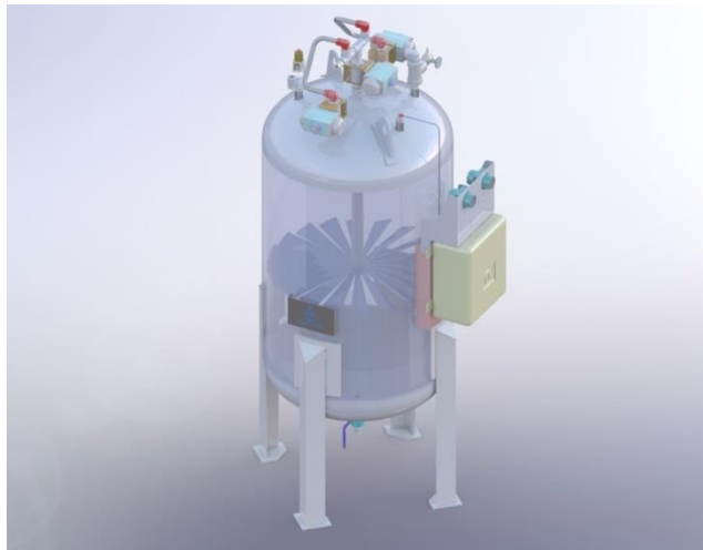
ถังที่ช่วยรักษาระดับความดันของก๊าซธรรมชาติให้คงที่ (Injection - NGV Trailer Decanting System (ITDS))

บริษัทฯ ได้จัดสิทธิบัตรถังที่ช่วยรักษาระดับความดันของก๊าซธรรมชาติให้คงที่ ซึ่งเป็นอุปกรณ์ที่ช่วยรักษาระดับความดันของก๊าซธรรมชาติให้คงที่ ทำให้สามารถสูบก๊าซจากรถขนส่งก๊าซ NGV ได้มากขึ้น และประหยัดต้นทุนในการขนส่งก๊าซ