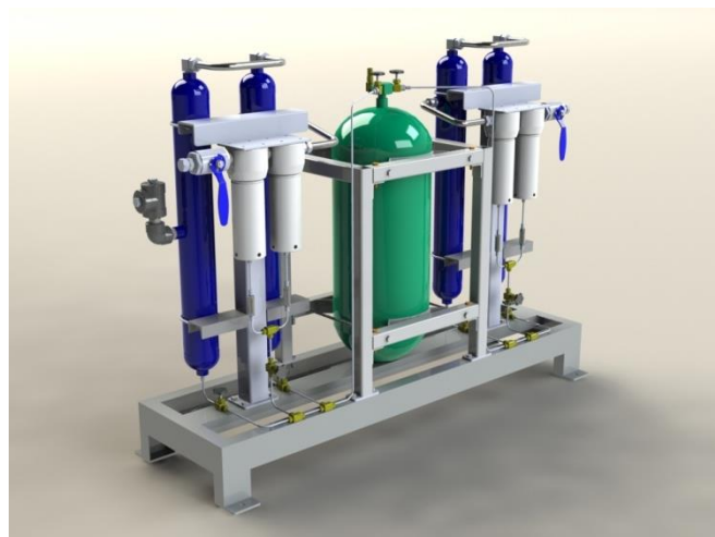
ระบบดักไอน้ำมันและสิ่งแปลกปลอมที่ปนมากับก๊าซธรรมชาติอัด (Oil Eliminator)