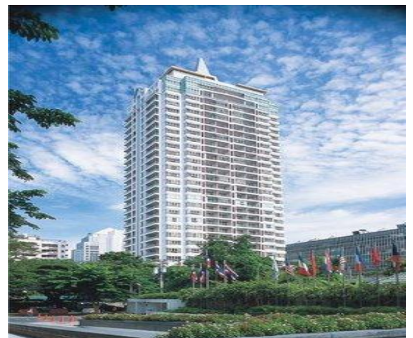
รูป และแผนที่ บริเวณจัดตั้งสาขาของบริษัท