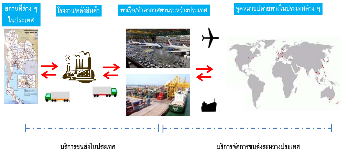
แผนภาพแสดงการเคลื่อนย้ายสินค้าและการให้บริการของบริษัท