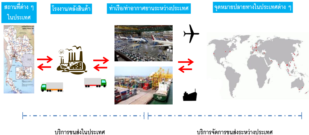
แผนภาพแสดงการเคลื่อนย้ายสินค้าและการให้บริการของบริษัท