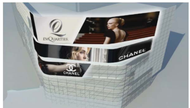
โครงการ Emquartier Outdoor