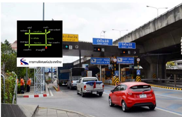
โครงการ Gateway Billboard Phase 2

นอกจากการเพิ่มเติมระบบการจราจรอัจฉริยะเข้าไปในป้ายโฆษณาแล้ว บริษัทฯ ยังได้ดำเนินการร่วมกับการทางพิเศษฯ และ BECL โดยเพิ่มการแสดงผลการคำนวณระยะเวลาการเดินทางโดยประมาณในป้ายรายงานสภาพการจราจรอัจฉริยะบริเวณด่านเก็บค่าผ่านทางบนทางด่วน จำนวนเพิ่มอีก 25 ป้าย (โครงการ Gateway Billboard Phase 2) เพื่อเป็นข้อมูลให้แก่ผู้ขับขี่และผู้ใช้งาน โดยคาดว่าจะใช้เงินลงทุนประมาณ 55 ล้านบาท และคาดว่าจะเริ่มให้บริการได้ภายในเดือนเมษายน 2558 โดยป้ายบางส่วนที่เพิ่มเติมจะเป็นพื้นที่โฆษณาที่เพิ่มรายได้ให้แก่บริษัทฯ