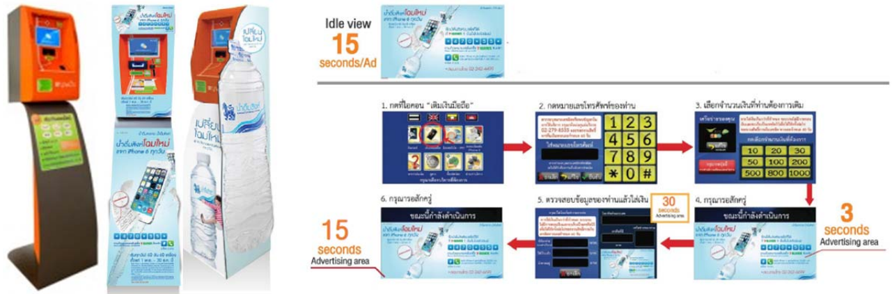
โครงการตู้เติมเงินในรูปแบบ Static และ Digital Media