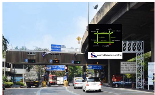
โครงการ Gateway Billboard Phase 2