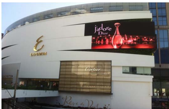
โครงการ Emporium Outdoor