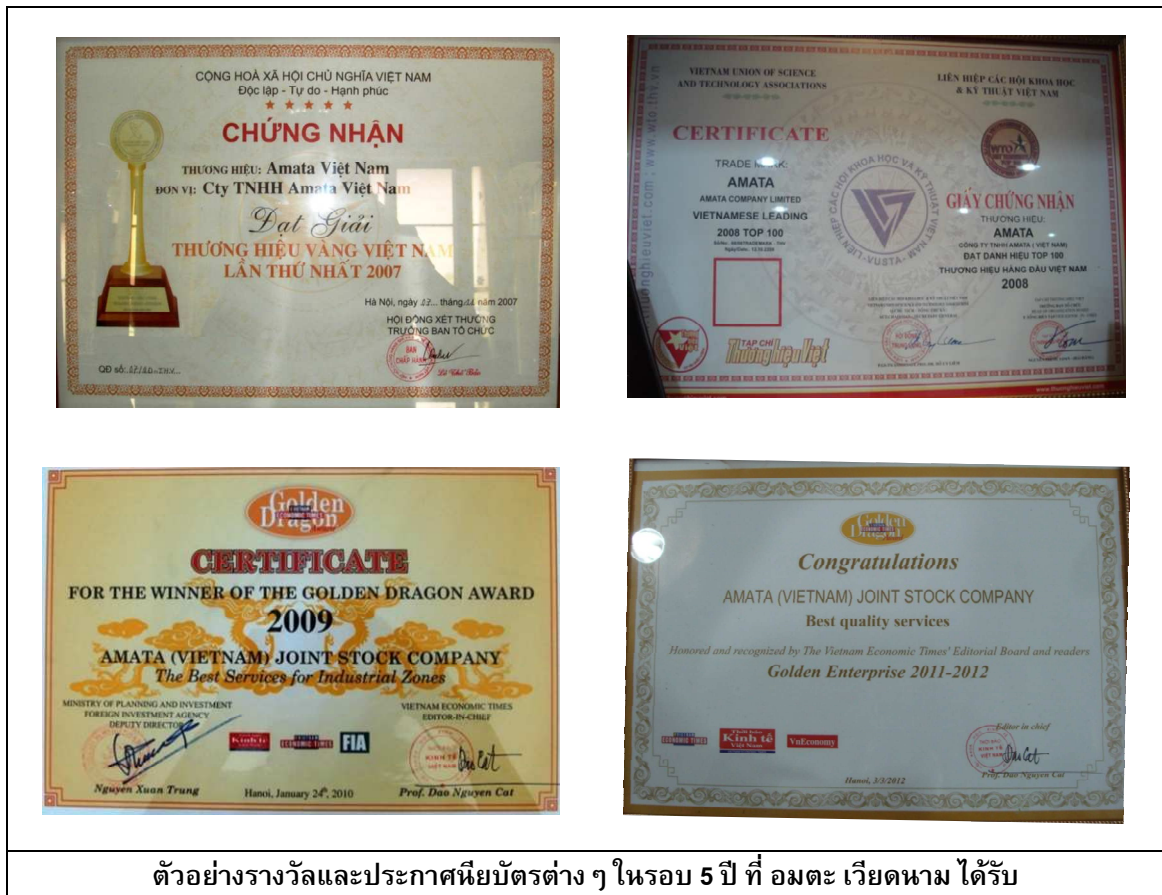
ตัวอย่างรางวัลและประกาศนียบัตรต่างๆ ในรอบ 5 ปี ที่ อมตะ เวียดนาม ได้รับ