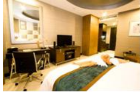
งานตกแต่งห้องพักโรงแรมโนโวเทล