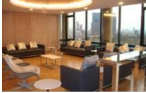
งานตกแต่งห้องประชุม ปตท.