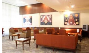
ห้องโถงรับรองของ King Power