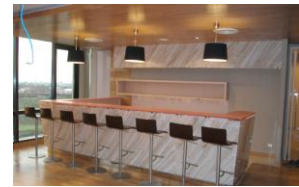
เคาน์เตอร์อาหารอาคารปตท.