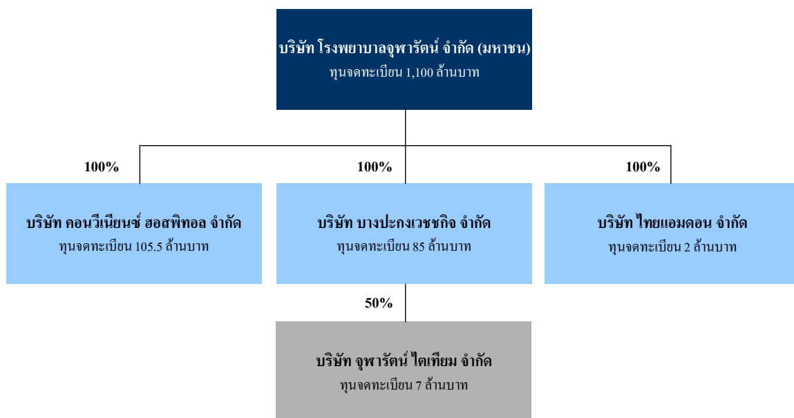
แผนภาพที่ 2-1 : โครงสร้างการถือหุ้นของกลุ่มบริษัท โรงพยาบาลจุฬารัตน์ จำกัด (มหาชน) ณ วันที่ 31 ธันวาคม 2555

หมายเหตุ : * อยู่ระหว่างการชำระบัญชีและปิดกิจการตามขั้นตอนทางกฎหมาย โดยคาดว่าจะแล้วเสร็จภายในปี 2556