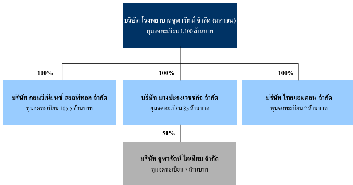
แผนภาพที่ 2-1 : โครงสร้างการถือหุ้นของกลุ่มบริษัท โรงพยาบาลจุฬารัตน์ จำกัด (มหาชน) ณ วันที่ 31 ธันวาคม 2555

หมายเหตุ : * อยู่ระหว่างการชำระบัญชีและปิดกิจการตามขั้นตอนทางกฎหมาย โดยคาดว่าจะแล้วเสร็จภายในปี 2556