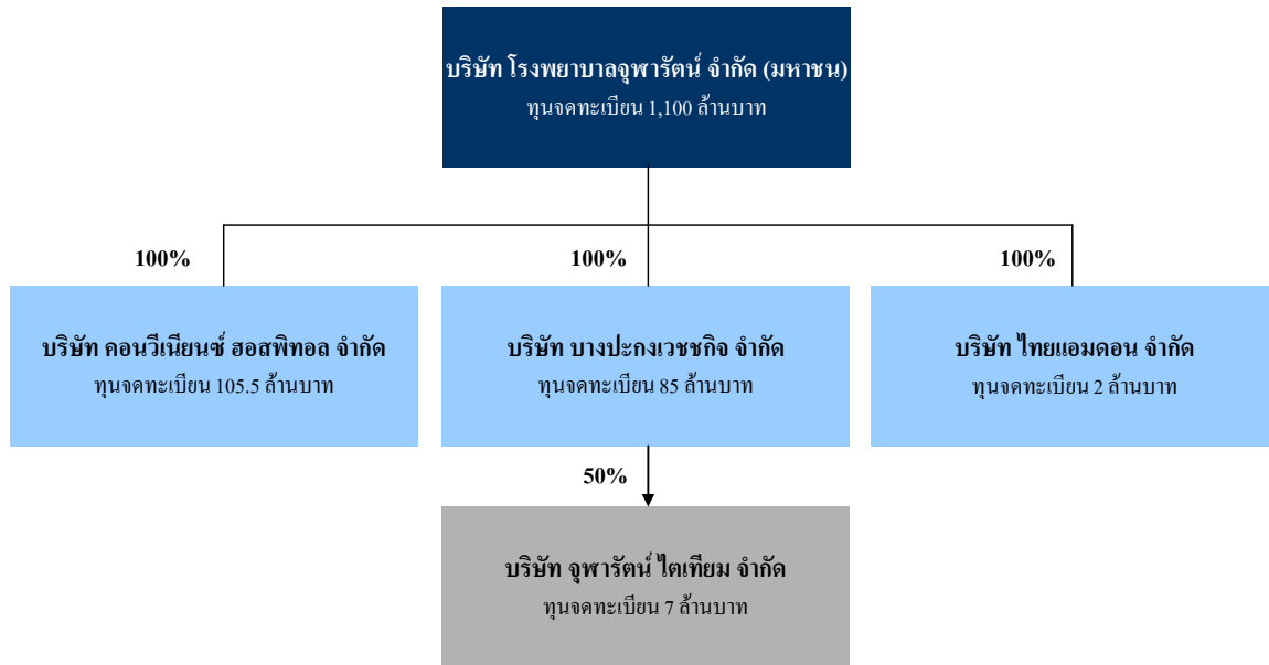
แผนภาพที่ 2-1 : โครงสร้างการถือหุ้นของกลุ่มบริษัท โรงพยาบาลจุฬารัตน์ จำกัด (มหาชน) ณ วันที่ 30 พฤศจิกายน 2555