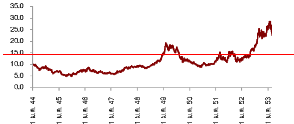
ราคาน้ำตาลทรายดิบตลาดนิวยอร์กหมายเลข 11

กราฟต่อไปนี้จะแสดงการเปลี่ยนแปลงของราคาน้ำตาลทรายดิบตั้งตั้งแต่ปี 2549 ถึงวันที่ 30-28 กุมภาพันธ์ กันยายน 2554