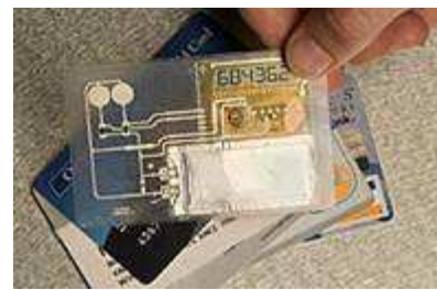
บัตรอัจฉริยะ (Intelligent Card)