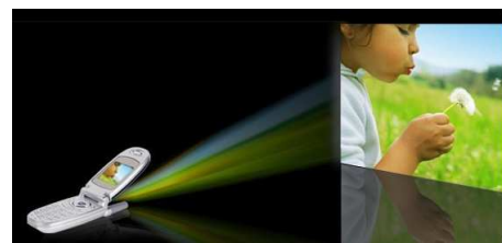
เครื่องโปรเจคเตอร์เลเซอร์พกพา (Portable Laser Projector)

ภาพจำลองการนำเครื่องโปรเจคเตอร์เลเซอร์พกพาไปประยุกต์ใช้ในโทรศัพท์มือถือ ซึ่งบริษัทกำลังร่วมพัฒนา