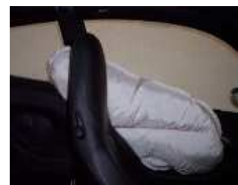
MEMS สำหรับถุงลมนิรภัยด้านข้างระหว่างคนขับและผู้โดยสาร (Side Airbag)