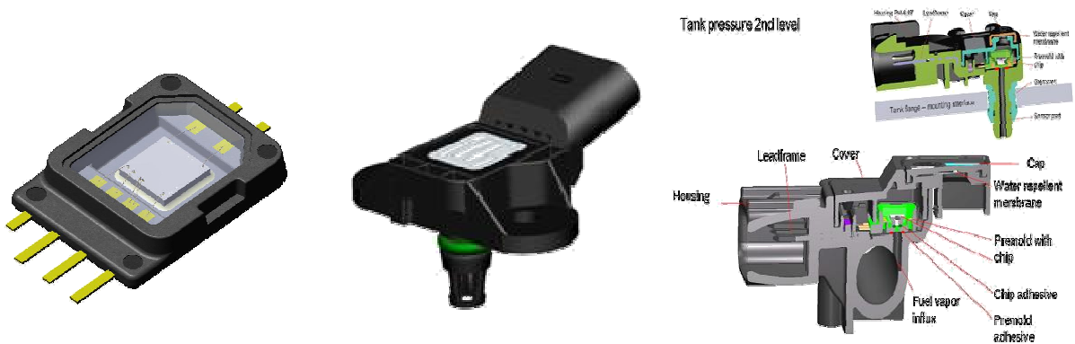
MEMS สำหรับวัดความดันเครื่องยนต์ดีเซล (Diesel Fuel Tank Pressure Sensor)

บริษัทได้มีการร่วมพัฒนาและออกแบบแผงวงจรไฟฟ้ารวมแบบระบบไฟฟ้าเครื่องกลจุลภาค (Micro-Electro-Mechanic Systems หรือ MEMS) สำหรับวัดความดันถึงน้ำมันของเครื่องยนต์ดีเซล (Diesel Fuel Tank Pressure Sensor) ร่วมกับ BOSCH มาตั้งแต่ปี 2551 โดย BOSCH เป็นองค์กรอุตสาหกรรมที่ใหญ่ที่สุดแห่งหนึ่งของโลก กลุ่มบริษัท BOSCH มีสำนักงานใหญ่ตั้งอยู่ที่ประเทศเยอรมนี มีพนักงานทั่วโลกรวมกว่า 280,000 คน และมียอดขายรวมกว่า 45.1 พันล้านยูโร ในปี 2551 บริษัทคาดว่าจะสามารถเริ่มการผลิตในเชิงพาณิชย์ได้ในไตรมาสที่ 3 ปี 2552 และคาดว่าจะได้รับการสั่งซื้อเบื้องต้นประมาณ 200,000 ชิ้นในครึ่งหลังของปี 2552 และเพิ่มเป็น 8,800,000 ชิ้นในปี 2553